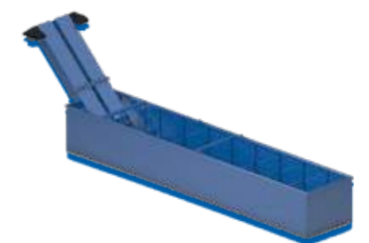
50DCC Tank / Tanques