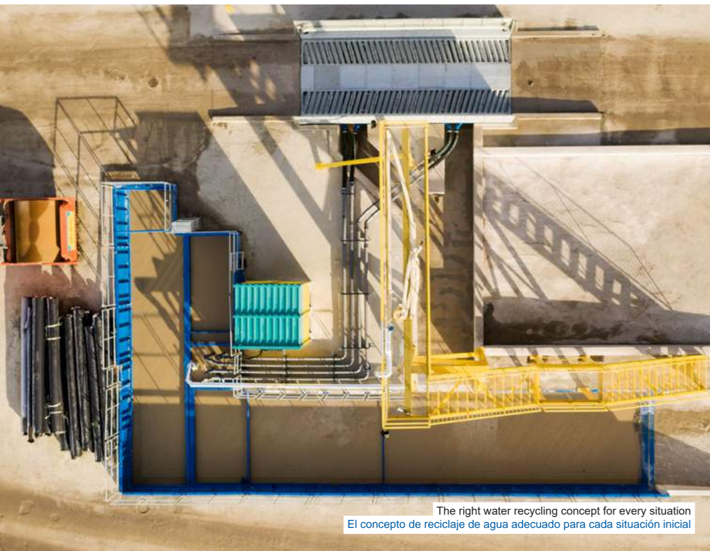
The right water recycling concept for every situation El concepto de reciclaje de agua adecuado para cada situación inicial

MobyDick recycling tanks come in various shapes and sizes. They can be combined as required. Depending on requirements, FRUTIGER works with the customer to develop a recycling concept that is optimally tailored to their wheel washing system in terms of volume and sludge emptying. Los tanques de reciclaje MobyDick tienen diferentes tamaños y formas. Pueden combinarse entre sí de cualquier manera. Según las necesidades, FRUTIGER desarrolla un concepto de reciclaje junto con el cliente, que se adapta de forma óptima a su sistema de lavado de neumáticos en términos de volumen y vaciado de lodos.