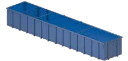
50B Réservoir / Serbatoio