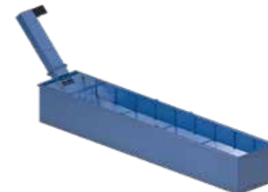
50CC / CCS Réservoir / Serbatoio