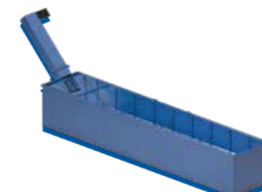
50XCC Réservoir / Serbatoio