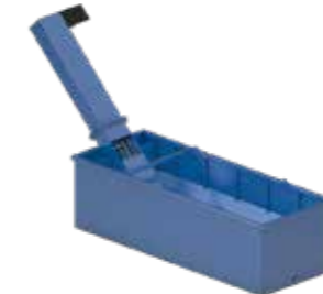
25CC Réservoir / Serbatoio