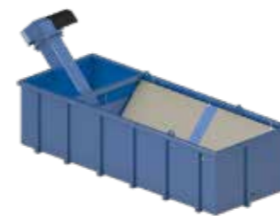
20C Réservoir / Serbatoio

Réservoirs de recyclage – évacuation des boues avec convoyeur à raclettes intégré Serbatoi di recupero – Evacuazione fanghi con nastro trasportatore a raschiamento