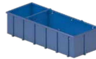
20B Réservoir / Serbatoio

Réservoirs de recyclage – évacuation des boues à l'aide d'une excavatrice ou d'un camion aspirateur Serbatoi di recupero – Evacuazione fanghi con escavatrice o autospurgo