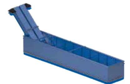
50DCC Réservoir / Serbatoio