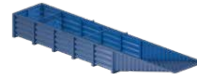
65RT Réservoir / Serbatoio

Réservoirs de recyclage – évacuation des boues avec convoyeur à raclettes intégré Serbatoi di recupero – Evacuazione fanghi con nastro trasportatore a raschiamento