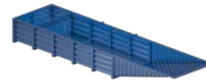
85RT Réservoir / Serbatoio