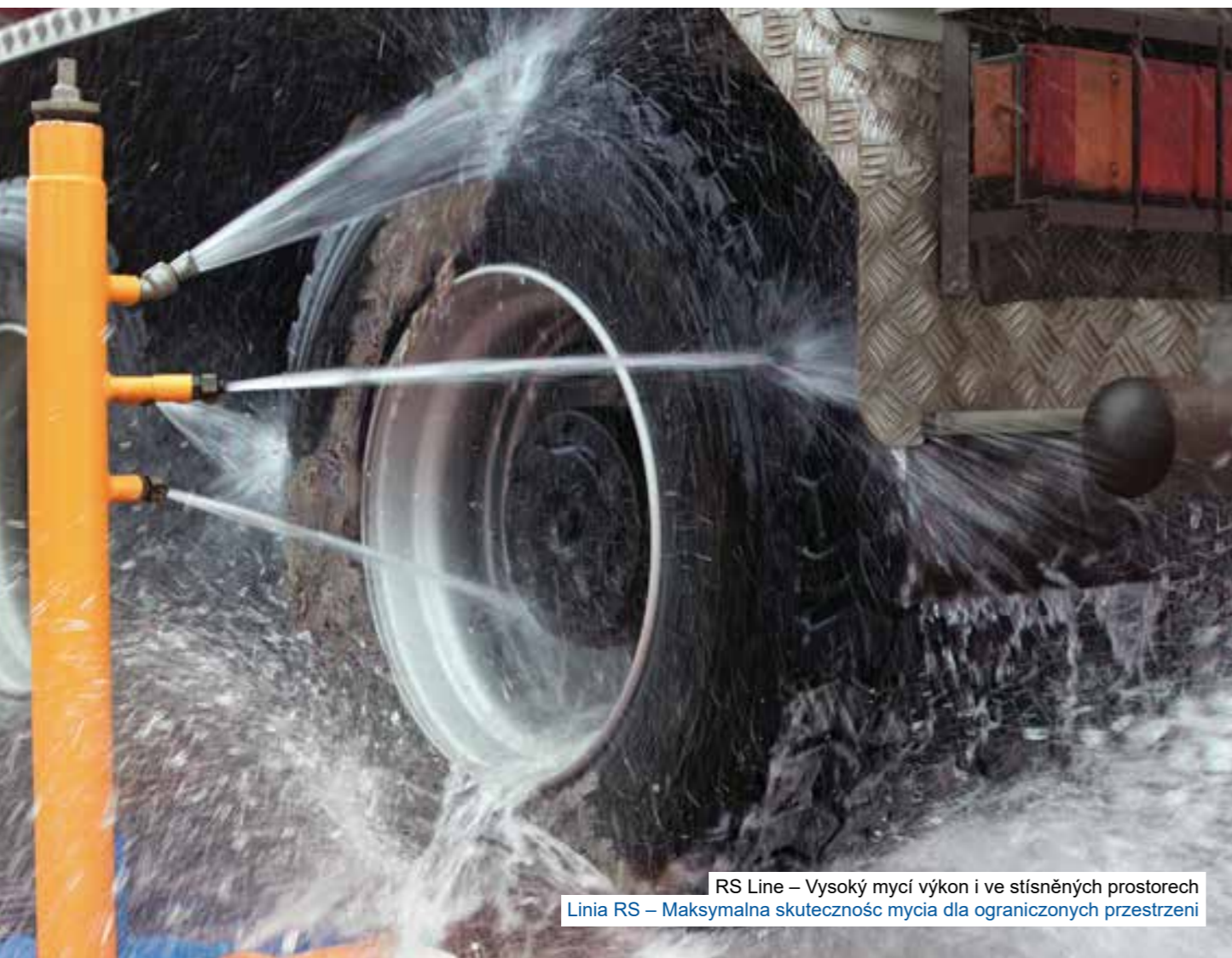
RS Line – Vysoký mycí výkon i ve stísněných prostorech Linia RS – Maksymalna skuteczność mycia dla ograniczonych przestrzeni

Kompaktní válcová zařízení (Junior a Duo) řady MobyDick RS Line mají velice vysokou mycí sílu a je možné je instalovat během krátké doby, a to i pokud je v místě instalace nedostatek místa. Recyklace vody probíhá přímo v zařízení. Nečistoty se automaticky vyvázejí na straně hrablovým dopravníkem. Ideální při nižší frekvenci nákladních automobilů a při vysokém stupni znečištění. Kompaktowe urządzenia rolkowe (Junior i Duo) z linii MobyDick RS mają wyjątkowo dużą moc mycia i mogą być zainstalowane w bardzo krótkim czasie nawet w trudnodostępnych miejscach. Recykling wody odbywa się bezpośrednio w urządzeniu. Zanieczyszczenia są automatycznie odprowadzane na zewnątrz urządzenia za pomocą przenośnika zgrzeblowego. Idealne rozwiązanie dla niewielkich ilości sanochodów ciężarowych i ciężkich zabrudzeń.