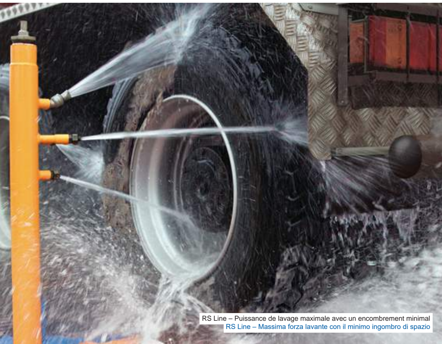
RS Line – Puissance de lavage maximale avec un encombrement minimal RS Line – Massima forza lavante con il minimo ingombro di spazio

Les systèmes de rouleaux compacts (Junior et Duo) de la gamme MobyDick RS offrent une puissance de lavage exceptionnellement élevée et peuvent être installés très rapidement, même dans des espaces très restreints. Le recyclage de l'eau a lieu directement dans l'installation. La saleté est automatiquement évacuée sur le côté par le racleur. Idéal pour une faible quantité de camions fortement encrassés. Gli impianti compatti a rulli (Junior e Duo) della linea MobyDick RS Line dispongono di un'eccezionale forza lavante e possono essere installati in tempi brevissimi anche in spazi molto ristretti. Il riciclo dell'acqua avviene direttamente nell'impianto. La sporcizia viene espulsa lateralmente in modo automatico per mezzo di nastri trasportatori a raschiamento. Ideali per quantità limitate di camion e alto grado di sporcizia.