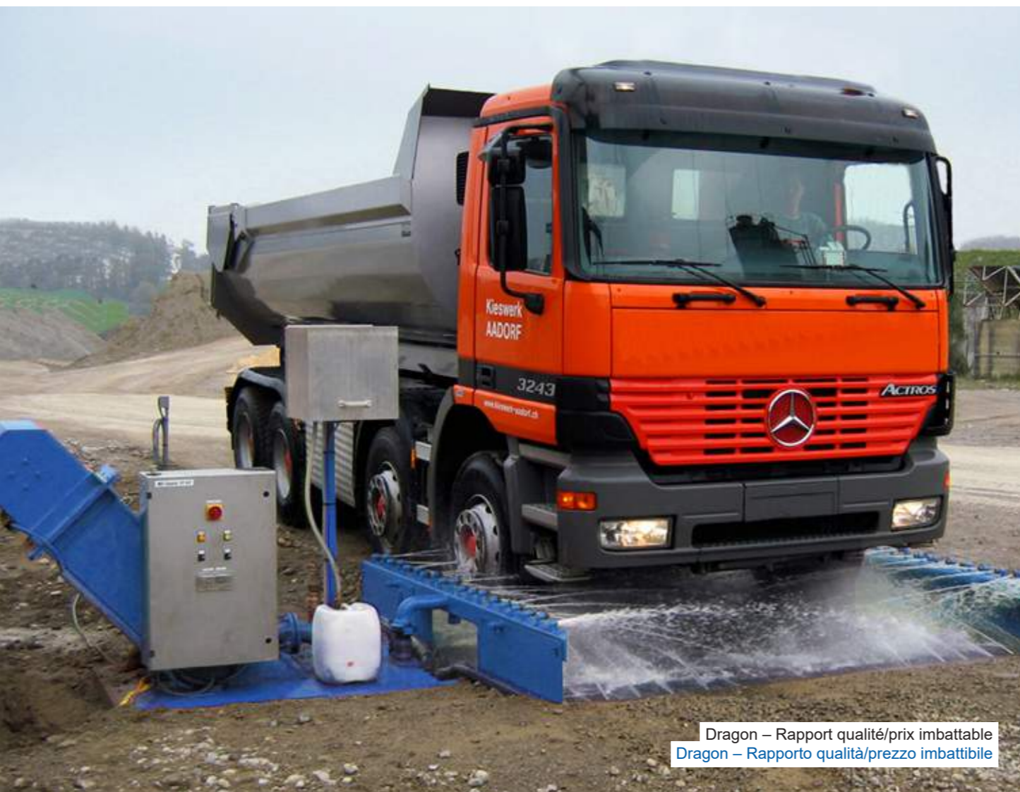
Dragon – Rapport qualité/prix imbattable Dragon – Rapporto qualità/prezzo imbattibile

Le MobyDick Dragon est un système de lavage de pneus puissant et compact composé d'une unité de lavage de 3,30 mètres de long avec un réservoir de recyclage intégré. Il est disponible au choix avec ou sans chaîne à racleurs et offre un rapport qualité/prix très attractif. La solution idéale pour une utilisation stationnaire ou mobile partout où les roues des camions ne sont pas très sales ou aux endroits où le problème réside dans la formation de poussière. L'installation se fait en quelques heures et ne nécessite qu'un minimum d'espace. MobyDick Dragon è un impianto di lavaggio ruote compatto ed efficiente costituito da un'unità di lavaggio lunga 3,30 metri e un serbatoio di recupero integrato. L'impianto è disponibile a scelta con o senza nastri trasportatori a raschiamento e offre un rapporto qualità/prezzo di sicuro interesse. La soluzione ideale come impianto sia fisso che mobile in qualsiasi contesto con basso livello di sporcizia delle ruote dei camion oppure per risolvere il problema della dispersione di polvere. L'installazione può essere completata in poche ore e richiede un ingombro di spazio minimo.